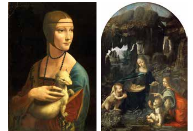
Dama amb un ermini La mare de Déu de les roques

El document va assolir l'efecte esperat perquè Leonardo da Vinci va estar al servei del duc Lluís I de Milà durant disset anys. Aquesta època va coincidir amb un període de maduresa científica i de gran esplendor artística. Algunes de les seves obres pictòriques més destacades corresponen a aquest període: La mare de Déu de les roques , Dama amb un ermini i el Sant Sopar , entre d'altres.